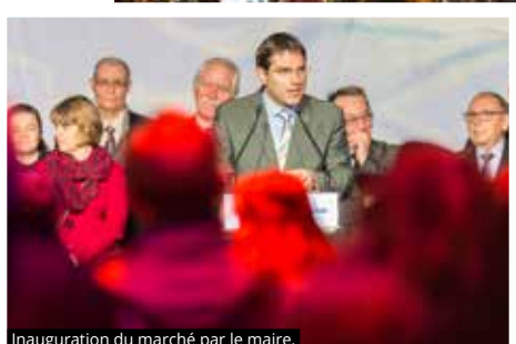
Inauguration du marché par le maire.