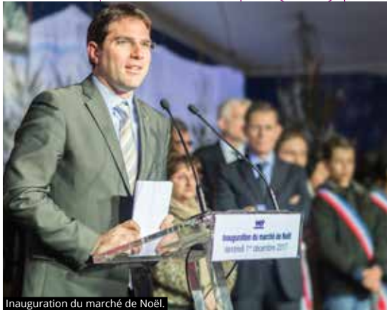
Inauguration du marché de Noël.

« En 2018, nous serons encore plus modernes, plus proches, plus à l'écoute »