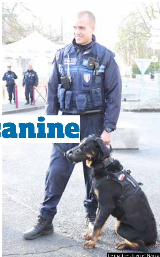
Le maître-chien et Narco.

En outre, un espace canin a été aménagé pour accueillir en journée Narco mais aussi les chiens errants. La