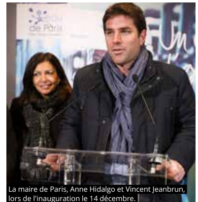
La maire de Paris, Anne Hidalgo et Vincent Jeanbrun, lors de l'inauguration le 14 décembre.

de l'inauguration. Cette réalisation importante pour la région Île-de-France envoie un signal fort. Elle témoigne de la nécessité pour les collectivités, entreprises et autres acteurs locaux, de se mettre autour de la table pour collaborer sur les questions de transition énergétique. La production d'électricité solaire sur le territoire l'haÿssien va permettre aujourd'hui de proposer aux usagers, sans aucun surcoût pour eux, un service public propre, durable, innovant et rentable, au service des générations futures ».