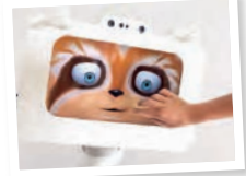
Le robot SPOON

concepteur du SPOON, robot de compagnie sensible aux émotions, nous aidera à faire le point lors d'une conférence (sam. 10 oct. à 15h, gratuit sur inscription).