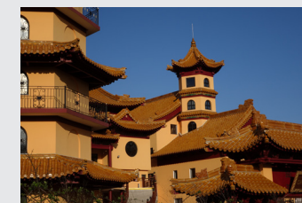
▲ Pagodes de Rémy Brun

Jeu di 25 janvier à 20h30 Espace culturel Dispan de Floran Ados/Adultes - Entrée libre Rens. : 07 77 44 31 06