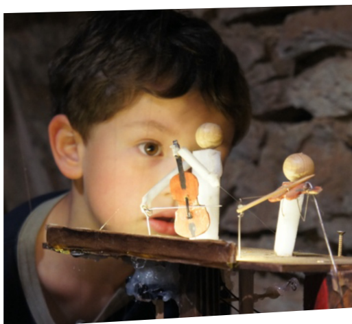
▲ L'Orchestre des On, une véritable expérience immersive et sensorielle

La Ville proposera également le samedi 27 janvier la deuxième édition de ses L'Haÿ E-Games au Moulin de la Bièvre. Au programme, tournois FC24 sur PS5, Super Smash Bros Ultimate sur Nintendo Switch, zone de jeux sur PC, PS5 et Nintendo Switch et réalité virtuelle. ■