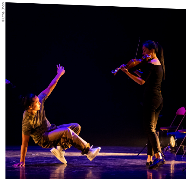
▲ Le grand retour à L'Haÿ de la compagnie Wanted Posse, championne du monde de hip hop