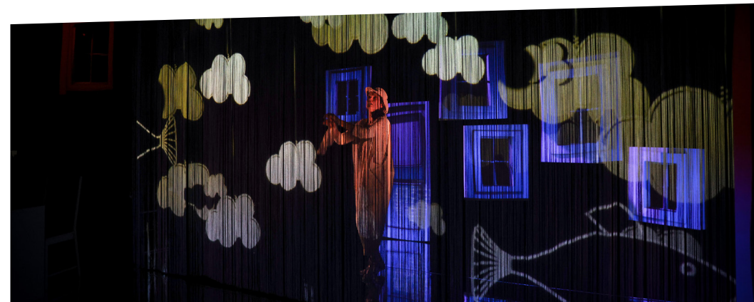
▲ Un spectacle proposé avec la bibliothèque dans le cadre de la huitième édition de Numéricité

Dans le cadre de la huitième édition de Numéricité, festival mêlant littérature, numérique et innovation technologique, la Bibliothèque vous propose, en partenariat avec l'Espace culturel Dispan de Floran, deux représentations du spectacle d'arts numériques Je vois ce que je crois , à voir dès six ans ! La place grandissante de la réalité virtuelle dans notre société déplace les frontières entre imaginaire, virtuel et réel, entre visible et invisible, croyance et expérience. En inversant la célèbre maxime « je ne crois que ce que je vois », ce spectacle joue avec notre perception du réel et interroge nos certitudes. En utilisant