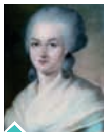
Olympe de Gouges

A l'occasion de la Journée internationale des Droits des Femmes, la Ville a souhaité étoffer le traditionnel programme proposé sur la journée du 8 mars.