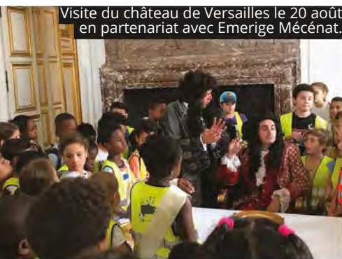
Visite du château de Versailles le 20 août en partenariat avec Emerige Mécénat.