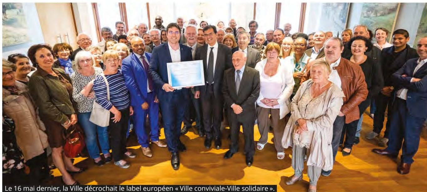
Le 16 mai dernier, la Ville décrochait le label européen « Ville conviviale-Ville solidaire ».

d'aides sociales légales (RSA, CMU, Allocation Personnalisée à l'Autonomie...) et propose aux personnes en grande difficulté, différentes aides facultatives et ponctuelles. Le CCAS peut par exemple prendre en charge une partie des factures de gaz et d'électricité, ou d'eau pour les foyers à faibles ressources. Il peut aussi octroyer une aide aux frais d'obsèques, ou encore une participation à la mobilité, etc. Ces aides individuelles ont un caractère exceptionnel. Elles permettent de répondre à des situations d'urgence (perte d'emploi, divorce, maladie...) et d'éviter à des familles de basculer plus avant dans la précarité.