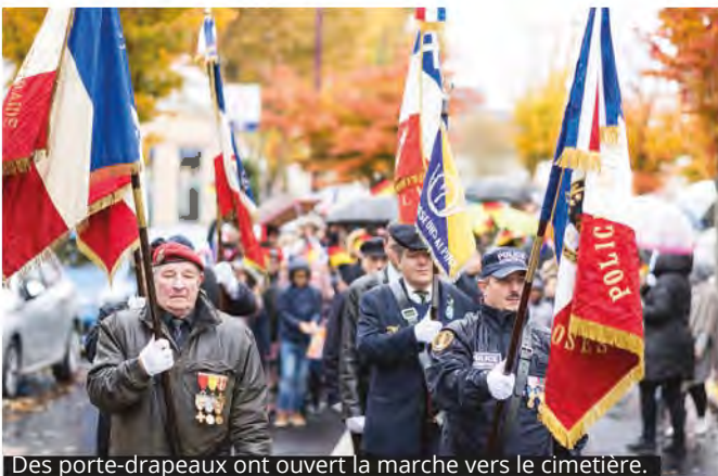
Des porte-drapeaux ont ouvert la marche vers le cimetière.