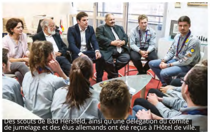
Des scouts de Bad Hersfeld, ainsi qu'une délégation du comité de jumelage et des élus allemands ont été reçus à l'Hôtel de ville.