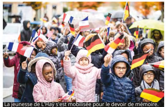
La jeunesse de L'Hay s'est mobilisée pour le devoir de mémoire.