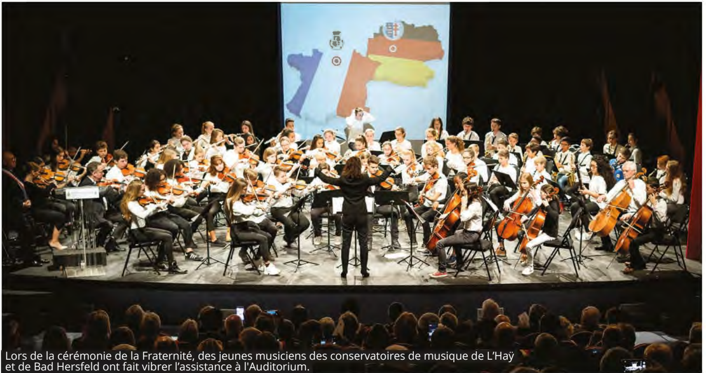
Lors de la cérémonie de la Fraternité, des jeunes musiciens des conservatoires de musique de L'Hay et de Bad Hersfeld ont fait vibrer l'assistance à l'Auditorium.