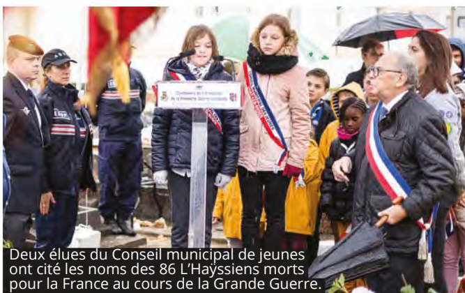
Deux élus du Conseil municipal de jeunes ont cité les noms des 86 L'Hayssiens morts pour la France au cours de la Grande Guerre.