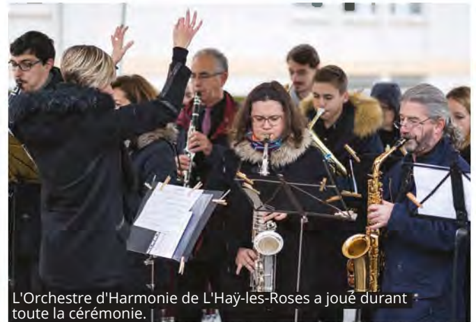
L'Orchestre d'Harmonie de L'Hay-les-Roses a joué durant toute la cérémonie.