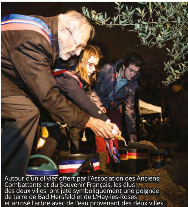
Autour d'un olivier offert par l'Association des Anciens Combattants et du Souvenir Français, les élus des deux villes ont jeté symboliquement une poignée de terre de Bad Hersfeld et de L'HaÏ-les-Roses et arrosé l'arbre avec de l'eau provenant des deux villes.

BAD HERSFELD ET L'HAÏ-LES-ROSES ONT SOUFFLÉ LES BOUGIES DE LEUR 30 ANS D'AMITIÉ ET ONT SIGNÉ LE RENOUVELLEMENT DE LA CHARTE DE JUMELAGE.