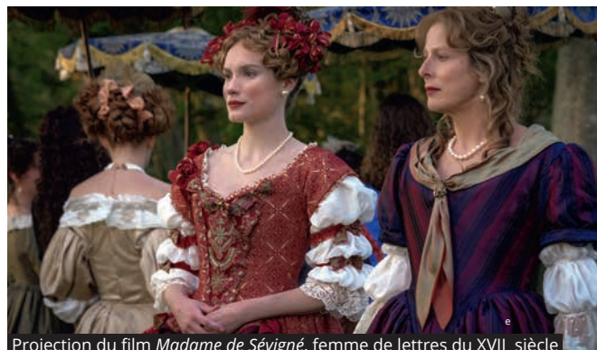
Projection du film Madame de Sévigné , femme de lettres du XVII e siècle

Le cinéma La Tournelle s'engage également en accueillant du 7 mars au 22 avril une exposition sur les figures féminines au cinéma. Jeudi 7 mars, à 20h30, il propose la projection de Blue Jean , un film britannique écrit et réalisé par Georgia Oakley qui met à l'honneur une jeune lesbienne au