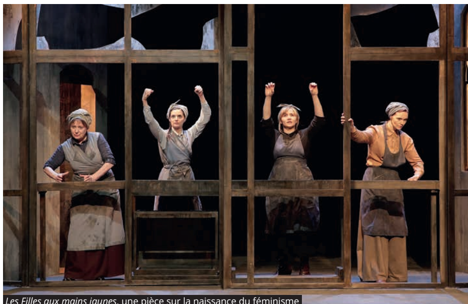
Les Filles aux mains jaunes , une pièce sur la naissance du féminisme

Plusieurs associations l'haÿssiennes se sont mobilisées pour participer à cet événement en faisant découvrir à toutes les femmes la richesse de l'offre sportive dans notre ville : CAL-Athlétisme, CAL-Darts, CAL-Football, CAL-Gymnastique, CAL-Handball,