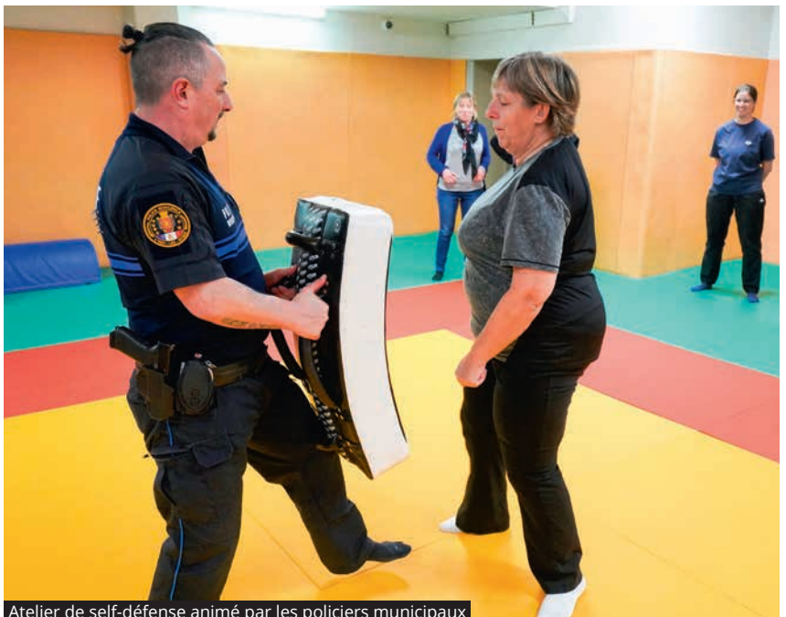
Atelier de self-défense animé par les policiers municipaux

Retrouvez le programme complet sur lhaylesroses.fr