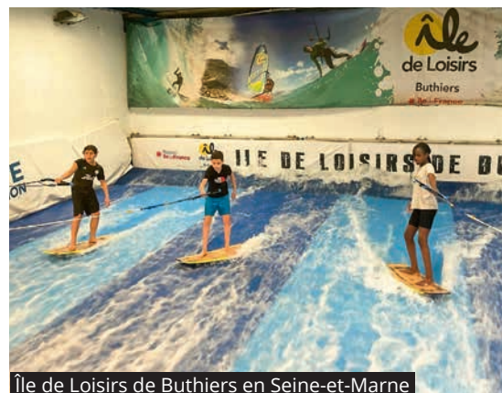
Île de Loisirs de Buthiers en Seine-et-Marne

Durant les vacances d'hiver, les jeunes L'Haÿssiens inscrits aux différentes activités du Service Municipal de la Jeunesse (SMJ) ont passé des moments inoubliables. Au programme : conception d'une borne d'arcade et ciné-débat au cinéma La Tournelle, sortie sportive avec escalade, tir à l'arc et glisse, périples à Trampoline Park, match PSG-Rennes au parc des Princes, sans oublier les activités se déroulant au sein du SMJ. Les jeunes ont pu se créer de beaux souvenirs de vacances. —