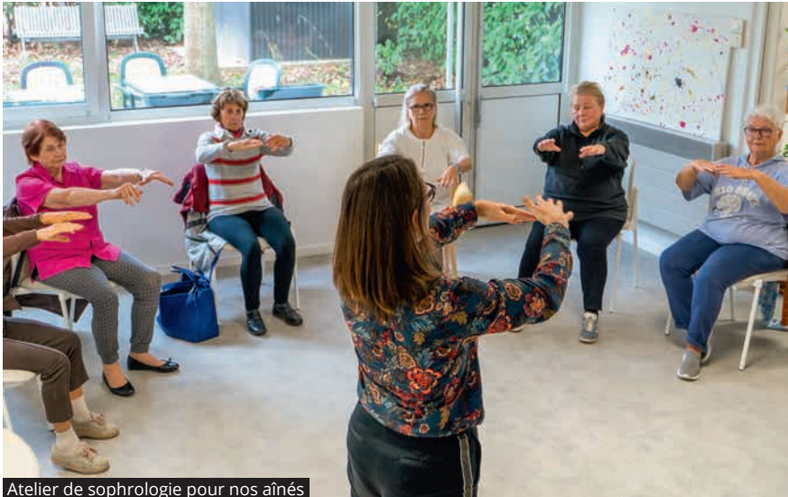
Atelier de sophrologie pour nos aînés

CAL-Judo, CAL-Karaté, CAL-Plongée, CAL-RCVB (Rugby), CAL-Sports loisirs, CAL-Tennis de table, CAL-Tir à l'arc, CAL-Yoga, CAL-Squash et CAL-Basket. Les inscriptions se feront auprès du service des Sports (01 46 15 34 57 ou sport@ville-lhay94.fr ).