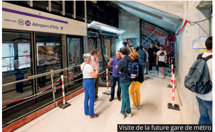
Visite de la future gare de métro