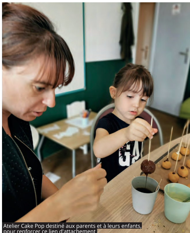
Atelier Cake Pop destiné aux parents et à leurs enfants, pour renforcer ce lien d'attachement

RETROUVER LE PROGRAMME COMPLET PRÉVU JUSQU'À FIN DÉCEMBRE SUR LE SITE DE LA VILLE EN FLASHANT LE QR CODE