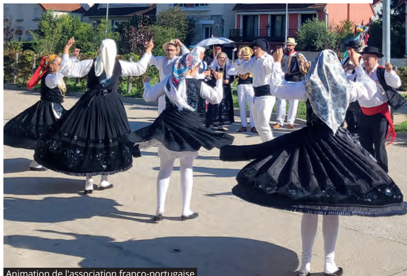
Animation de l'association franco-portugaise