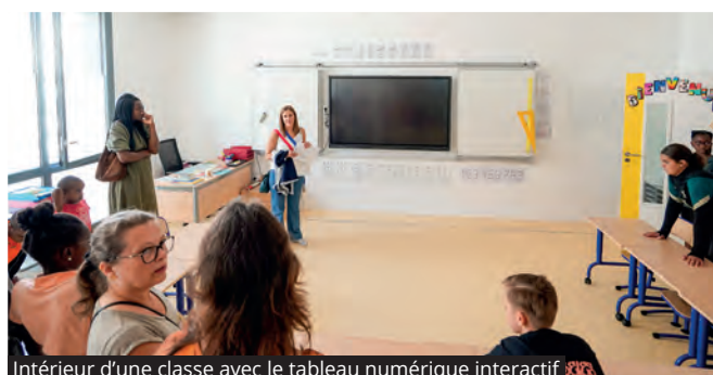
Intérieur d'une classe avec le tableau numérique interactif

LE 2 SEPTEMBRE A EU LIEU L'INAUGURATION DU NOUVEAU GROUPE SCOLAIRE GENEVIÈVE DE GAULLE-ANTHONIOZ. LES PARTENAIRES ET LES PARENTS ONT PU DÉCOUVRIR ET VISITER CE NOUVEL ÉQUIPEMENT FLAMBANT NEUF.