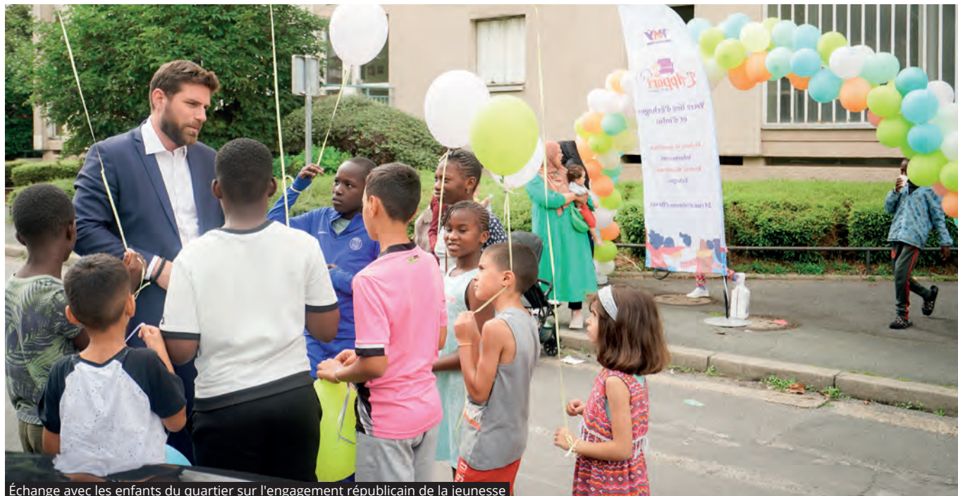
Échange avec les enfants du quartier sur l'engagement républicain de la jeunesse