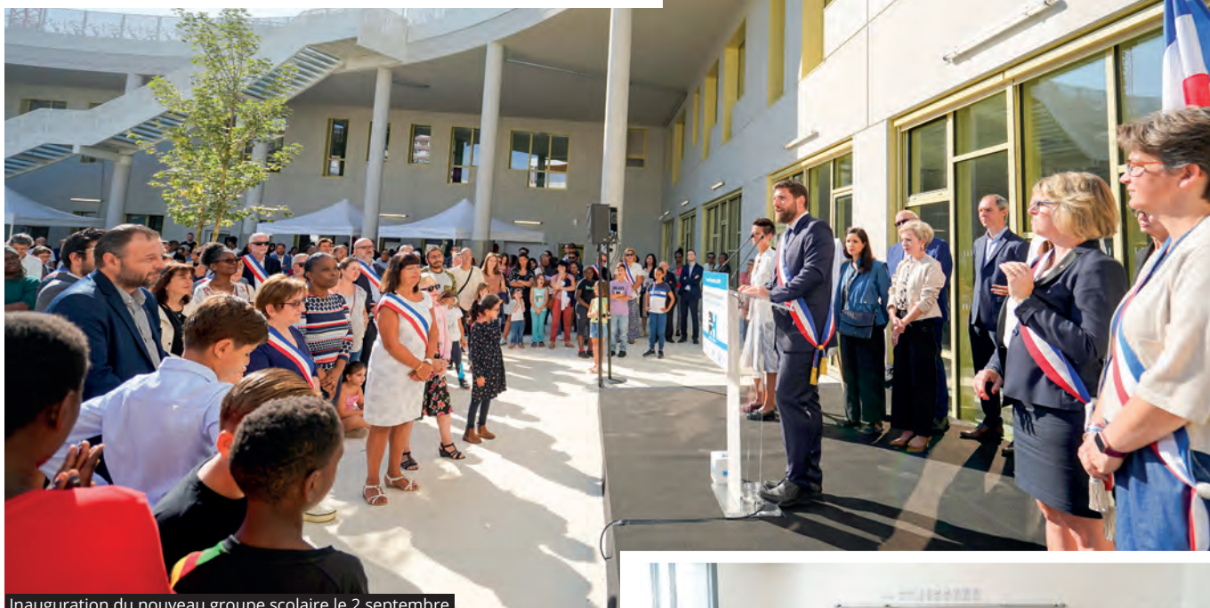
Inauguration du nouveau groupe scolaire le 2 septembre

LE 2 SEPTEMBRE A EU LIEU L'INAUGURATION DU NOUVEAU GROUPE SCOLAIRE GENEVIÈVE DE GAULLE-ANTHONIOZ. LES PARTENAIRES ET LES PARENTS ONT PU DÉCOUVRIR ET VISITER CE NOUVEL ÉQUIPEMENT FLAMBANT NEUF.