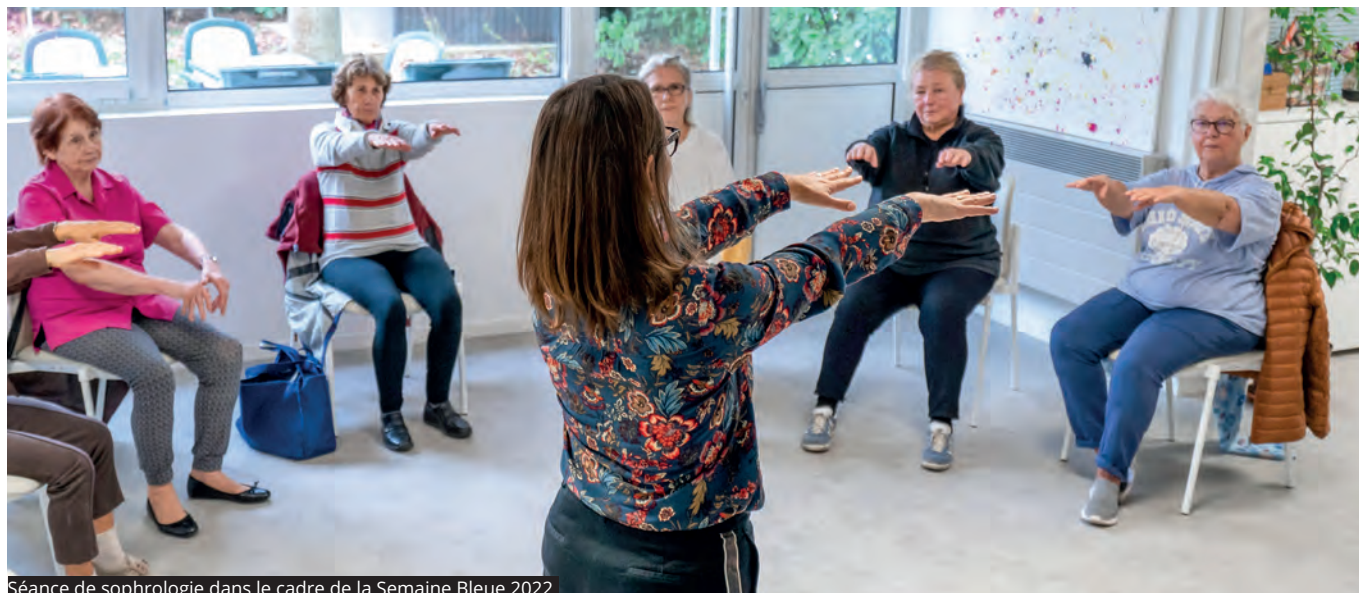
Séance de sophrologie dans le cadre de la Semaine Bleue 2022