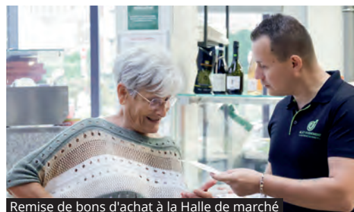
Remise de bons d'achat à la Halle de marché