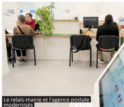
Le relais-mairie et l'agence postale modernisés