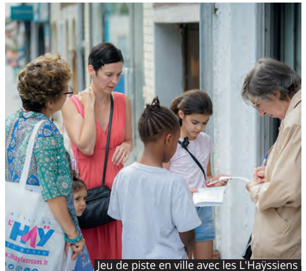
Jeu de piste en ville avec les L'Haÿssiens