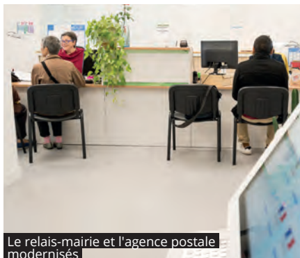
Le relais-mairie et l'agence postale modernisés