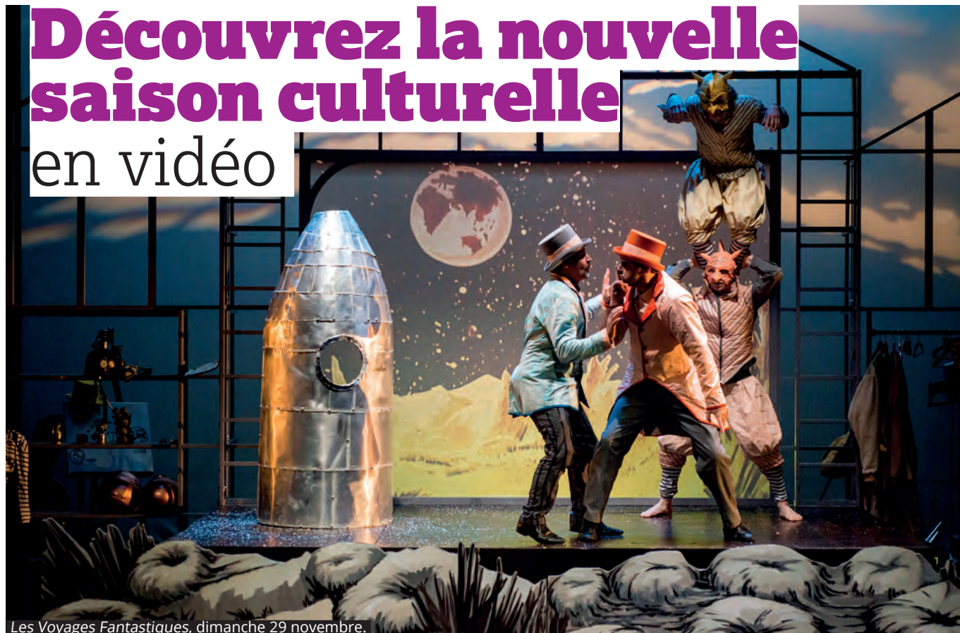
Les Voyages Fantastiques, dimanche 29 novembre.