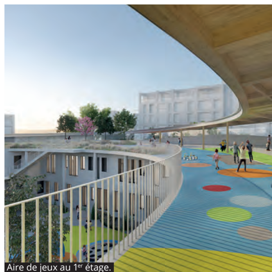
Aire de jeux au 1 er étage.