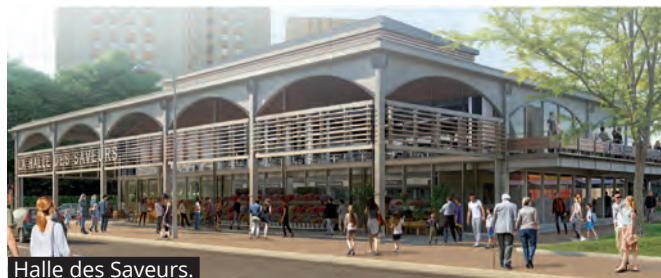
Halle des Saveurs.