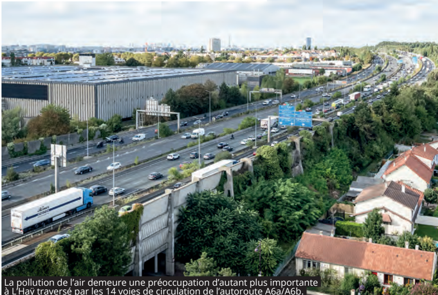
La pollution de l'air demeure une préoccupation d'autant plus importante à L'Haÿ traversé par les 14 voies de circulation de l'autoroute A6a/A6b.

COMME LE SOUHAITENT LES L'HAÏSSIENS AYANT PARTICIPÉ À LA CONCERTATION RELATIVE AU PROJET DE CRÉATION DE ZONE À FAIBLES ÉMISSIONS QUE VEUT IMPOSER LA MÉTROPOLÉ DU GRAND PARIS À TOUTES LES VILLES INCLUSES DANS LE PÉRIMÈTRE DE L'AUTOROUTE A86, LA VILLE POSE PLUSIEURS CONDITIONS À SON APPLICATION.