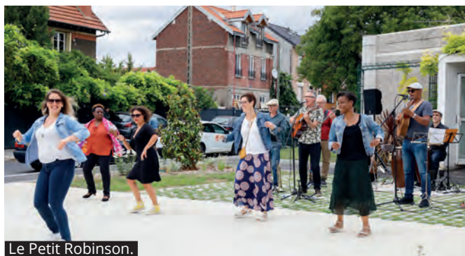
Le Petit Robinson.