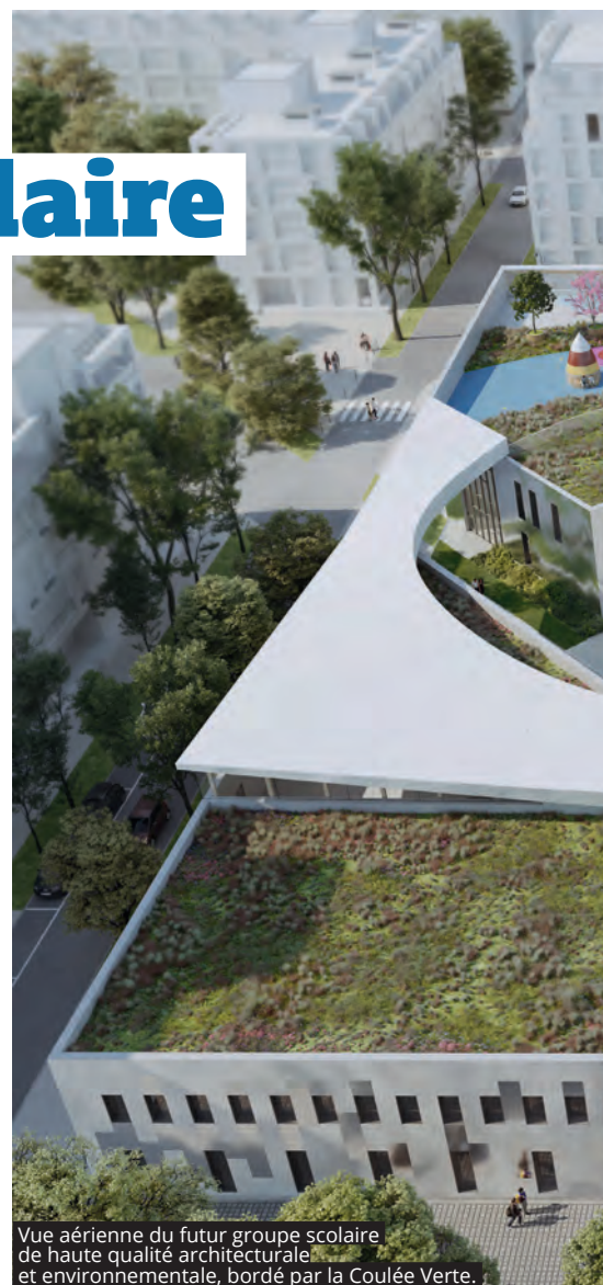
Vue aérienne du futur groupe scolaire de haute qualité architecturale et environnementale, bordé par la Coulée Verte.

à une meilleure répartition des équipements scolaires et sportifs entre les secteurs Lallier et Paul Hochart. La Ville a ainsi pris en compte l'arrivée de nouveaux habitants et une meilleure accessibilité de la part de la population actuelle aux groupes scolaires aujourd'hui localisés sur un seul site, à Lallier. Aussi, il est prévu de reconstruire, en lieu et place des deux écoles maternelles et deux écoles élémentaires vieillissantes de Lallier et du gymnase dont l'état de vétusté est avéré, une école maternelle et une école élémentaire avec son équipement sportif sur chacun des deux secteurs (Lallier et Paul Hochart), soit deux groupes scolaires avec un total de 50 classes contre 30 aujourd'hui. Le secteur Paul Hochart accueillera donc