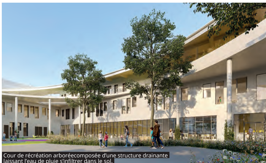
Cour de récréation arborée composée d'une structure drainante laissant l'eau de pluie s'infiltrer dans le sol.