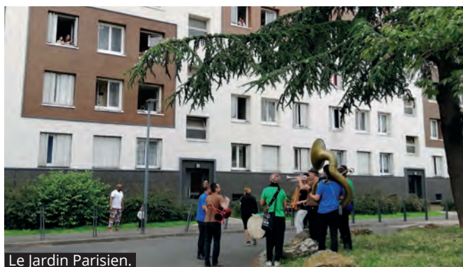
Le Jardin Parisien.