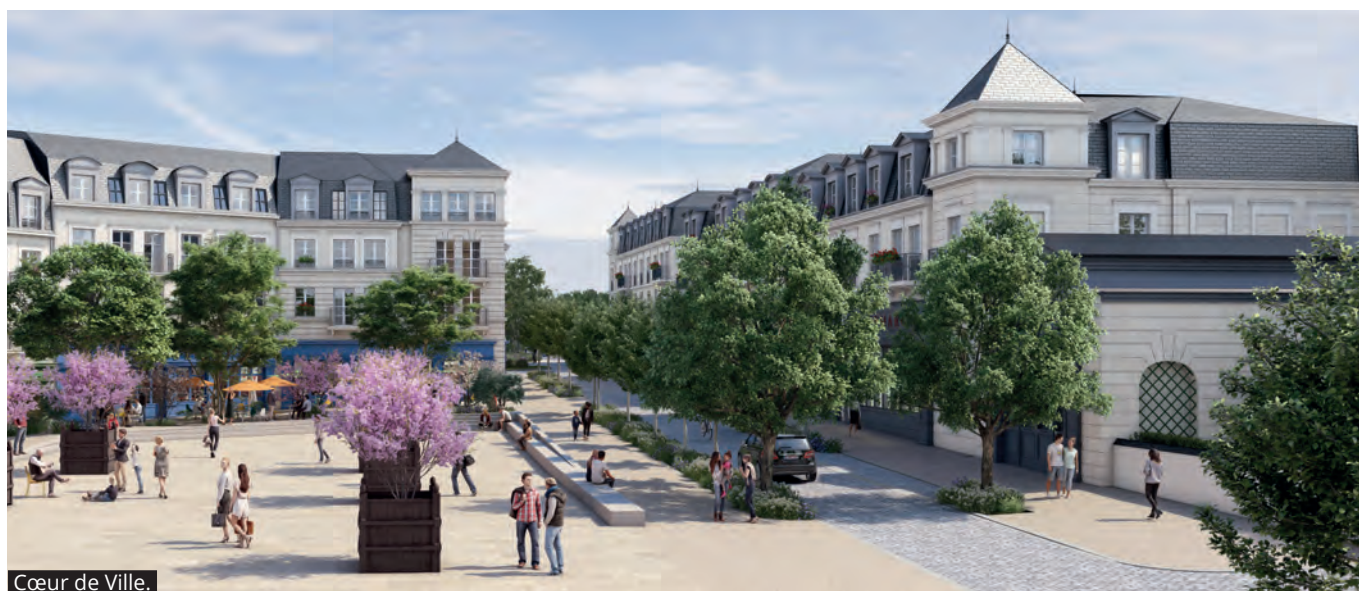
Cœur de Ville.