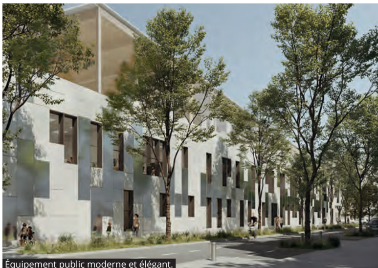
Équipement public moderne et élégant.