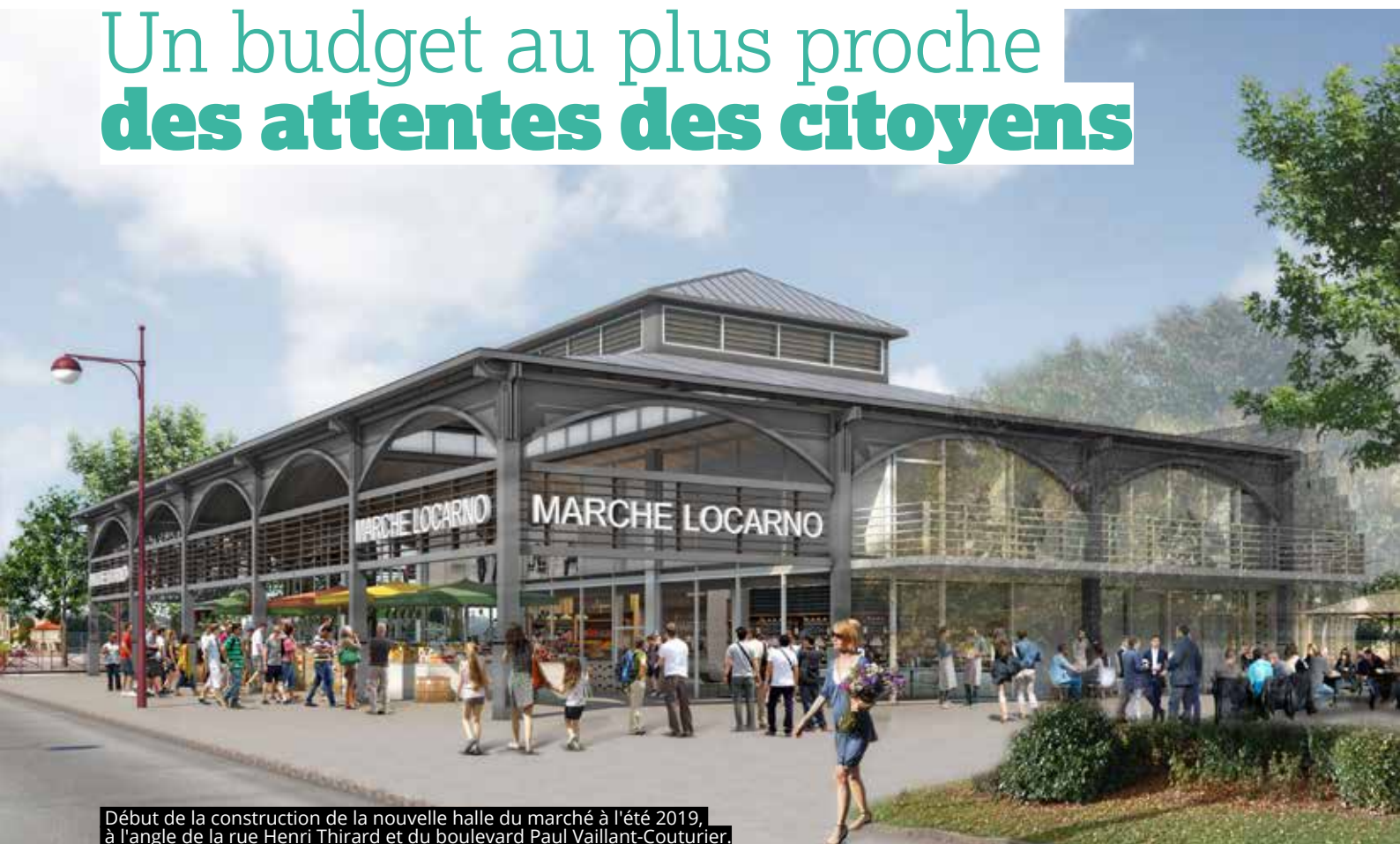
Début de la construction de la nouvelle halle du marché à l'été 2019, à l'angle de la rue Henri Thirard et du boulevard Paul Vaillant-Couturier.