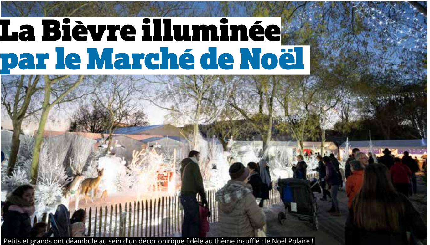
Petits et grands ont déambulé au sein d'un décor onirique fidèle au thème insufflé : le Noël Polaire !

C'est un marché de Noël féerique qui a investi pour la première fois l'esplanade de la Bièvre à l'occasion de son 25 e anniversaire, lors du premier week-end de décembre. Les milliers de visiteurs ont su apprécier les nombreuses