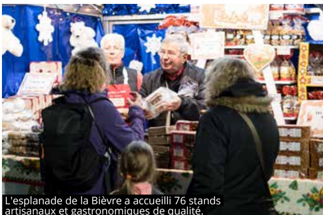
L'esplanade de la Bièvre a accueilli 76 stands artisanaux et gastronomiques de qualité.