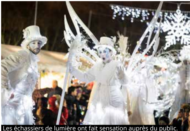
Les échassiers de lumière ont fait sensation auprès du public.