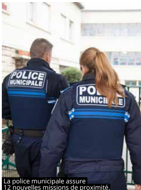
La police municipale assure 12 nouvelles missions de proximité.

Chaque euro perçu est utilement dépensé pour rénover, améliorer et moderniser la Ville.