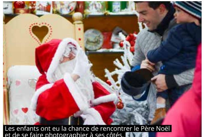
Les enfants ont eu la chance de rencontrer le Père Noël et de se faire photographier à ses côtés.