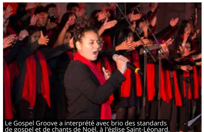
Le Gospel Groove a interprété avec brio des standards de gospel et de chants de Noël, à l'église Saint-Léonard.