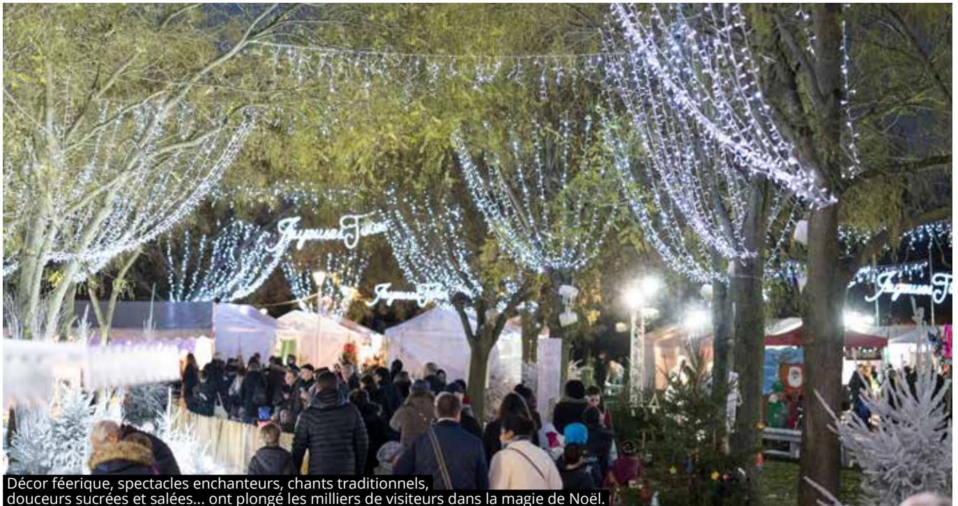
Décor féerique, spectacles enchanteurs, chants traditionnels, douceurs sucrées et salées... ont plongé les milliers de visiteurs dans la magie de Noël.