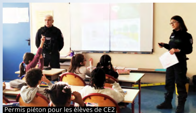
Permis piéton pour les élèves de CE2

La Police municipale a également fait passer le permis piéton aux 350 élèves de CE2 de la ville. Les élèves de CM1 et CM2 ont été sensibilisés par la Police municipale à la prévention des violences (harcèlement scolaire, dangers d'Internet...). En juin dernier, les agents de la Police municipale ont effectué une sensibilisation aux risques de la route auprès des jeunes de 15 à 20 ans en situation de handicap de la Section d'Initiation et de Formation Pré-Professionnelle (SIFPRO) de l'Institut Monique Guilbot.