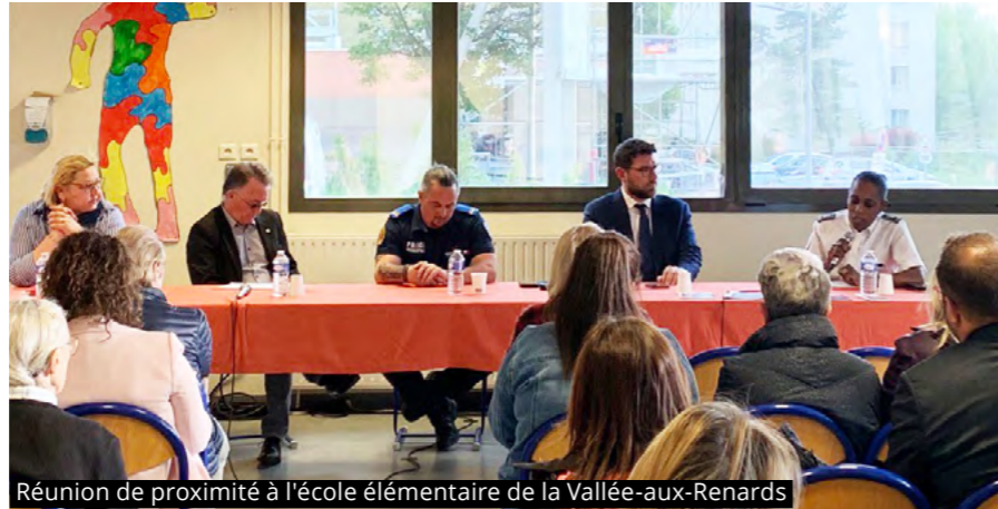
Réunion de proximité à l'école élémentaire de la Vallée-aux-Renards