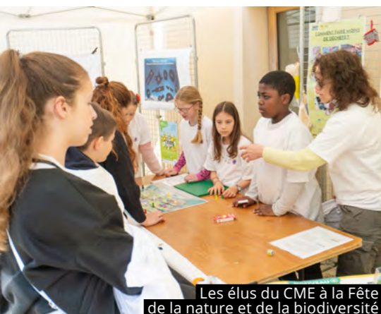
Les élus du CME à la Fête de la nature et de la biodiversité

LES ÉLUS DU CONSEIL MUNICIPAL DES ENFANTS (CME) ET DU CONSEIL MUNICIPAL DES JEUNES (CMJ) MÈNENT DE BEAUX PROJETS POUR LA VILLE.