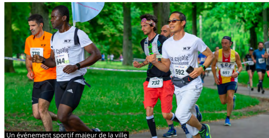
Un événement sportif majeur de la ville

JUIN MERCREDI 21 Fête de la musique La Fête de la musique aura lieu mercredi 21 juin . Ce rendez-vous populaire et spontané s'adresse à tous les publics. Il vise à mettre en lumière les pratiques amateurs. Rappelons que cette date n'a pas été choisie au hasard puisqu'elle correspond au solstice d'été, journée la plus longue de l'année. La Ville vous donne rendez-vous au square Bad Hersfeld, devant l'Espace culturel Dispan de Floran, à partir de 18h30. Ce sera une scène ouverte qui mettra en avant les talents du territoire.