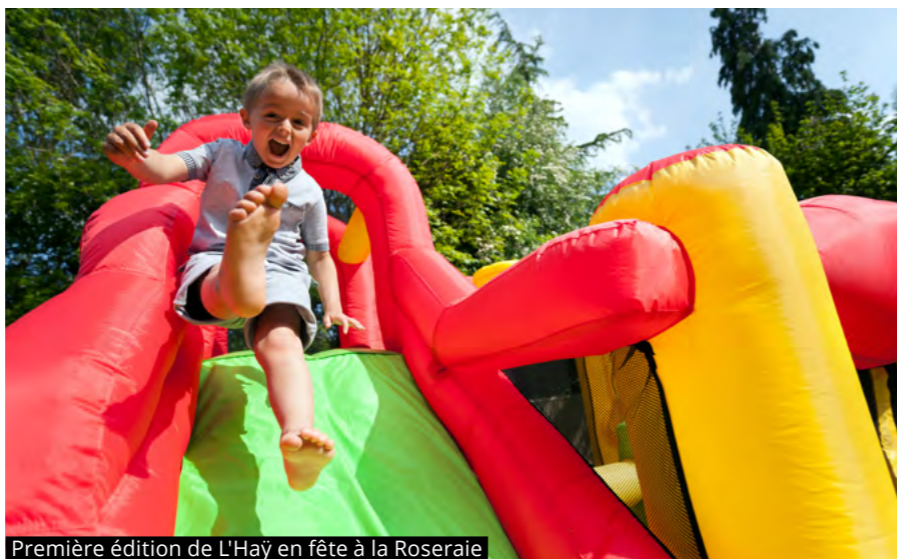
Première édition de L'Haÿ en fête à la Roseraie