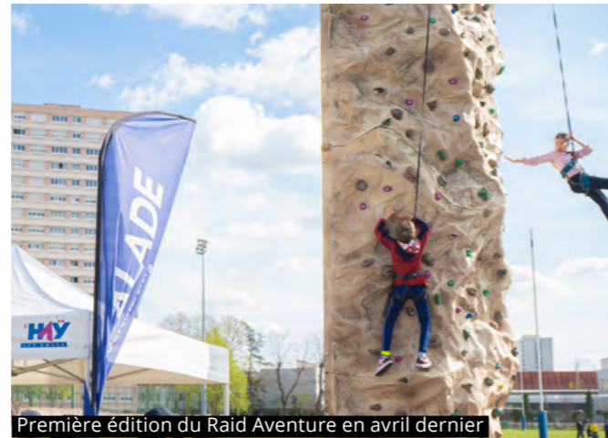
Première édition du Raid Aventure en avril dernier

Grande nouveauté cette année : pour créer des moments d'échanges entre la jeunesse et la Police municipale, cette dernière a organisé la 1 ère édition du Raid aventure pour les jeunes de 8 à 18 ans au mois d'avril, au stade L'Haÿette. Tout au long de la journée, divers ateliers ludiques et acti-