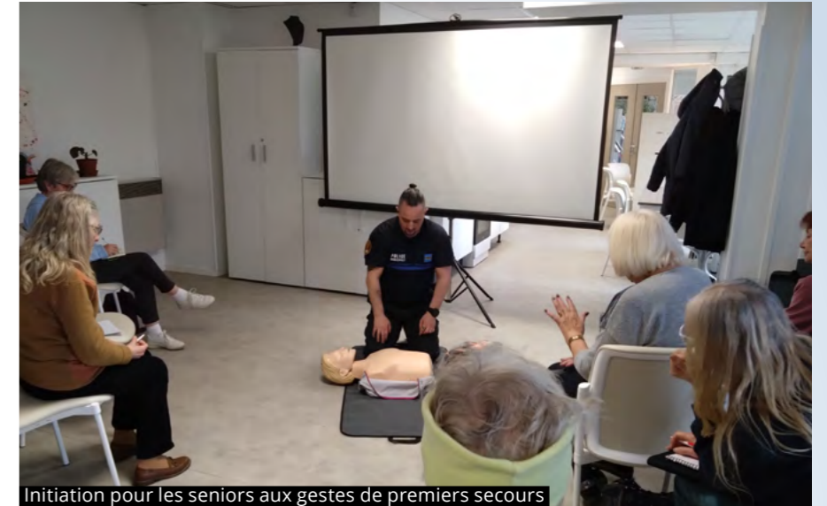
Initiation pour les seniors aux gestes de premiers secours

L'été approche ainsi que les départs en vacances. Si vous souhaitez partir la tête tranquille, vous pouvez bénéficier de l'opération Tranquillité Vacances : des patrouilles de Police municipale viennent régulièrement vérifier votre domicile. Ce dispositif gratuit permet de lutter contre les cambriolages dans les logements inoccupés. Pour en bénéficier, il suffit de se rendre à la Police municipale 48h à l'avance avec une pièce d'identité et un justificatif de domicile de moins de 3 mois. Vous pouvez également remplir le formulaire via Monlhay.fr .