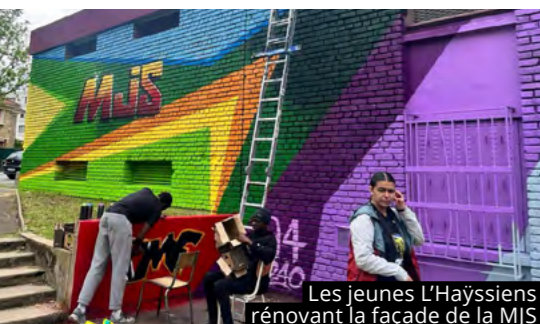
Les jeunes L'Hayssiens rénovant la façade de la MJS

Le Service Municipal de la Jeunesse (SMJ) propose de nombreuses activités pour les jeunes L'Hayssiens au cours du mois de juin et durant les vacances d'été. Le 3 juin, à partir de 14h, aura lieu une animation ouverte