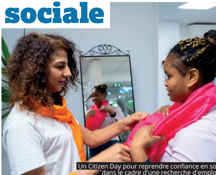
Un Citizen Day pour reprendre confiance en soi dans le cadre d'une recherche d'emploi

LE CENTRE COMMUNAL D'ACTION SOCIALE (CCAS) A POUR MISSION DE PORTER LA POLITIQUE SOCIALE DE LA VILLE, NOTAMMENT AUPRÈS DES PERSONNES EN DIFFICULTÉ, DES SENIORS ET DES PERSONNES SOUFFRANT D'UN HANDICAP. C'EST POURQUOI LE CCAS DE L'HAÏ MÈNE UNE POLITIQUE AMBITIEUSE EN FAVEUR DE LA SOLIDARITÉ.