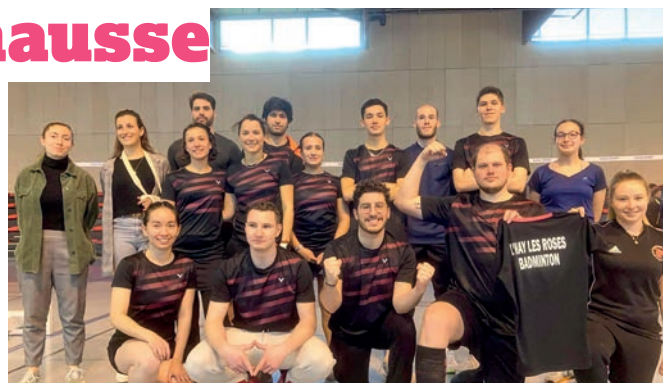
Des joueurs du CAL Badminton lors de l'organisation d'un tournoi interclubs