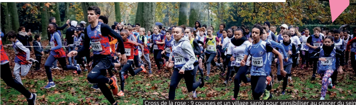
Cross de la rose : 9 courses et un village santé pour sensibiliser au cancer du sein

DIMANCHE 16 OCTOBRE, DANS LE CADRE DE LA CAMPAGNE D'OCTOBRE ROSE, LE CAL ATHLÉTISME ORGANISE LE CROSS DE LA ROSE, DE 9H À 14H, AU PARC DÉPARTEMENTAL DE LA ROSERAIE, EN PARTENARIAT AVEC LE CENTRE MUNICIPAL DE SANTÉ (CMS) DE LA VILLE.