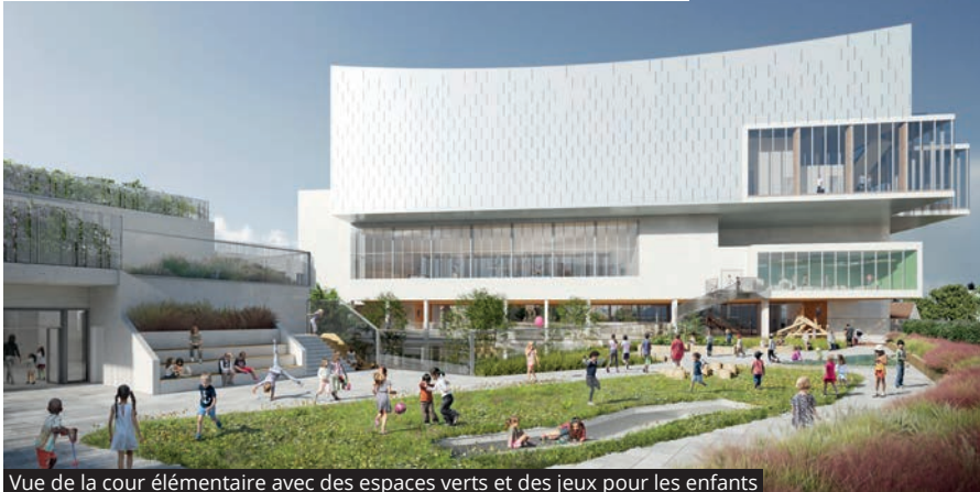
Vue de la cour élémentaire avec des espaces verts et des jeux pour les enfants

Un nouveau groupe scolaire de 5 100 m 2 va être construit sur un site stratégique, à proximité de la future gare de métro. Cette construction fait partie du projet de renouvellement urbain du quartier de Lallier. Il accueillera 25 classes (10 maternelles et 15 élé-